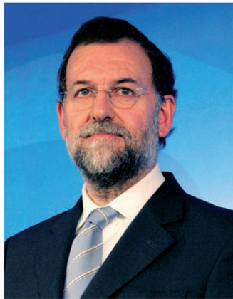
Presidente del Gobierno. D. Mariano Rajoy