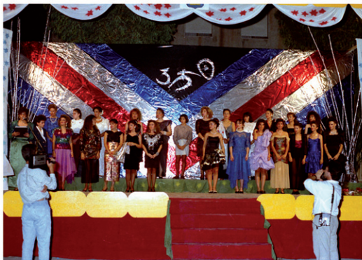
350 Aniversario Villa de Rafal Homenaje a las últimas Reinas