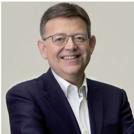
Presidente de la Generalitat. D. Ximo Puig